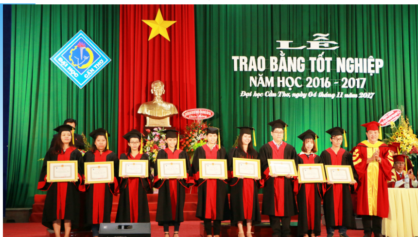
Trao khen thưởng cho sinh viên tốt nghiệp Xuất sắc và Giỏi.

Sáng ngày 04/11/2017, Trường ĐHCT tổ chức Lễ Trao bằng tốt nghiệp hệ vừa làm vừa học và hệ từ xa năm học 2017-2018 tại Hội trường Lớn. Tham dự buổi lễ có đại diện lãnh đạo các đơn vị liên kết, các tân cử nhân, kỹ sư và thân nhân đến mừng lễ tốt nghiệp. Về phía Trường ĐHCT có Ban Giám hiệu, đại diện lãnh đạo và cán bộ chuyên trách các đơn vị trong Trường.