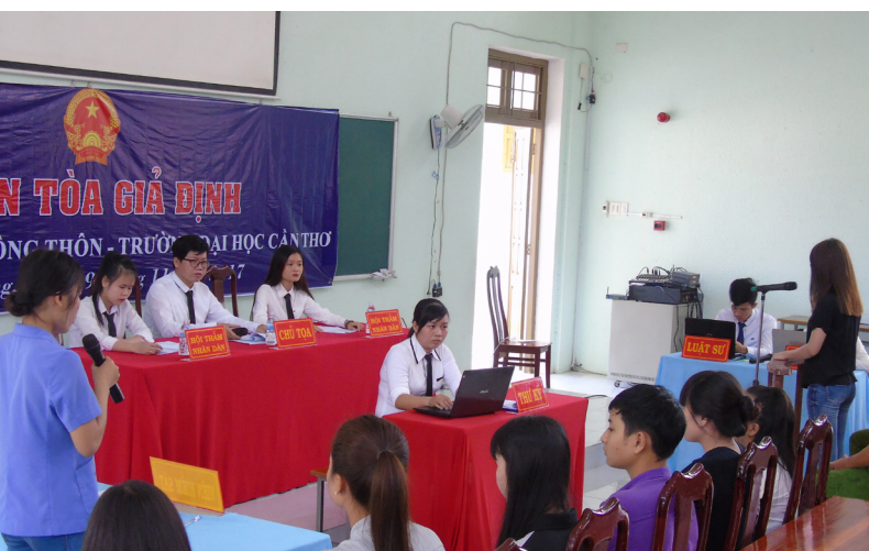
Đại diện Viện kiểm sát truy tố hành vi phạm tội của bị cáo.

Hoạt động này đã thu hút hơn 100 sinh viên tham dự. Nhân dịp này, Ban Thường vụ Đoàn Khoa cũng trao Quyết định kiện toàn Ban Chủ nhiệm Câu lạc bộ Thực hành nghề Luật nhiệm kỳ 2017 – 2018.