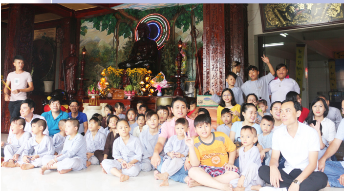
Toàn cảnh buổi giao lưu với các em nhỏ.

Sáng ngày 19/11/2017, Chi đoàn Phòng Kế hoạch Tổng hợp-Thanh tra Pháp chế-Trung tâm Thông tin và Quản trị mạng của Đoàn khối Phòng ban kết hợp với Công đoàn đơn vị đã tổ chức hoạt động thăm, tặng quà và giao lưu với trẻ em mồ côi tại chùa Bửu Trì (Số 67, đường Mậu Thân, Xuân Khánh, thành phố Cần Thơ). Hoạt động có sự tham gia của đoàn viên Đoàn khối Phòng ban; đoàn viên Đoàn cơ sở Phòng Tham mưu, Công an Thành phố Cần Thơ.