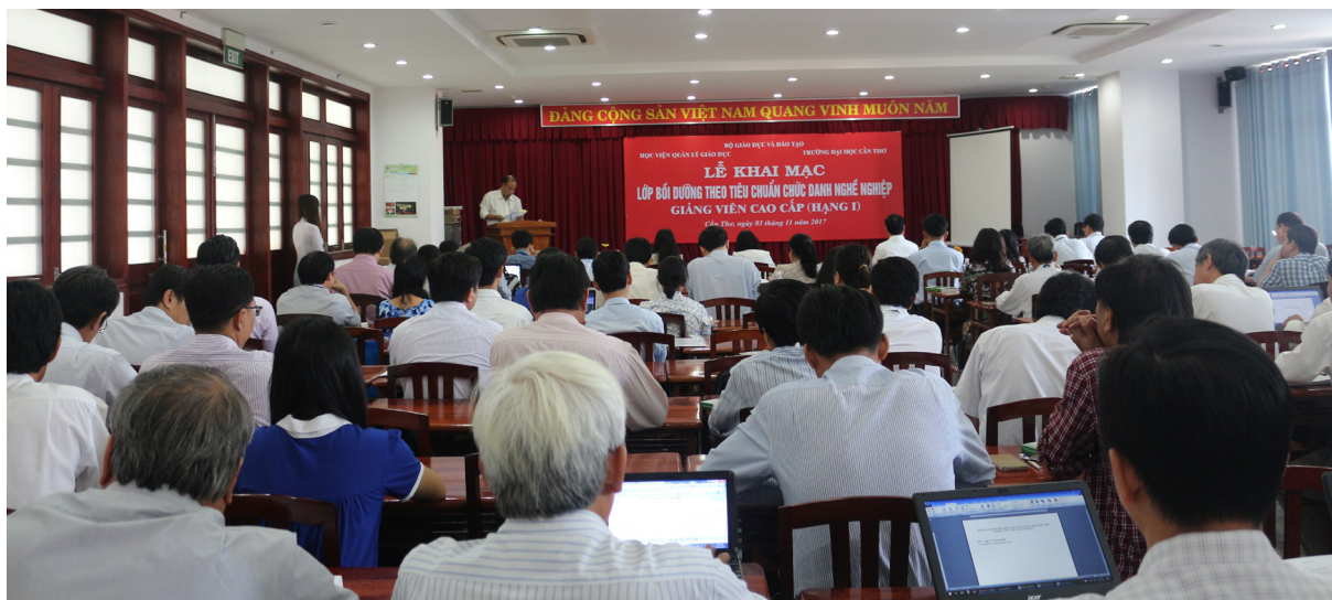
Lễ khai giảng diễn ra tại Nhà Điều hành, Trường ĐHC.T.

Với mục đích nâng cao năng lực phát triển chuyên môn nghề nghiệp và thực hiện tốt nhiệm vụ của viên chức giảng dạy, đáp ứng tiêu chuẩn chức danh nghề nghiệp Giảng viên cao cấp (hạng I), Trường ĐHC.T đã phối hợp với Học viện Quản lý Giáo dục tổ chức khai giảng Lớp bồi dưỡng chứng chỉ Giảng viên cao cấp hạng I vào ngày 03/11/2017.