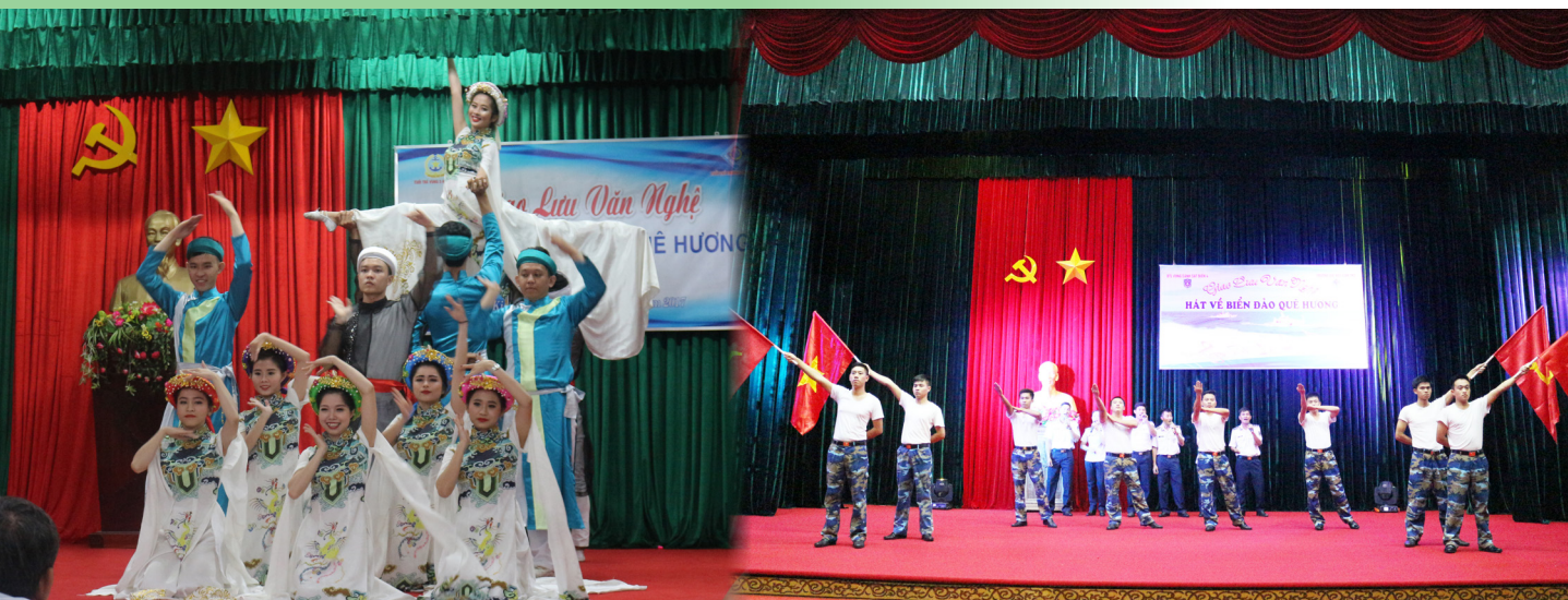
Một số tiết mục văn nghệ trong đêm giao lưu.

Tình yêu biển, đảo được nhân lên trong đêm giao lưu văn nghệ với chủ đề “Hát về biển, đảo quê hương” ngay trên Đảo Ngọc-Phú Quốc, huyện đảo giàu truyền thống cách mạng, đang phát triển mạnh mẽ, tươi đẹp và mến khách. Thông qua những lời ca, tiếng hát, điệu múa, những tiết mục văn nghệ đặc sắc, trẻ trung, sôi động trong chương trình giao lưu, tuổi trẻ của hai đơn vị càng hiểu sâu sắc hơn về tầm quan trọng của biển, đảo Việt Nam; qua đó củng cố lòng yêu nước, yêu biển, đảo quê hương; đồng thời tăng cường mối quan hệ đoàn kết quân-dân; từ đó nâng cao trách nhiệm trong bảo vệ vững chắc chủ quyền và thực thi pháp luật trên vùng biển Tây Nam của Tổ quốc.