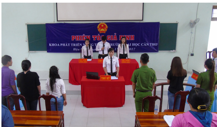
Chủ tọa phiên tòa đọc bản tuyên án.

Ngày 19/11/2017, Câu lạc bộ Thực hành nghề Luật thuộc Đoàn Khoa Phát triển Nông thôn đã tổ