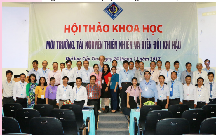
Ảnh lưu niệm tại Hội thảo.

Những kết quả nghiên cứu trên góp phần cung cấp thông tin khoa học cho nghiên cứu ứng dụng vào điều kiện thực tế của địa phương hoặc làm cơ sở tham khảo cho các công trình nghiên cứu ở địa phương và các cấp.