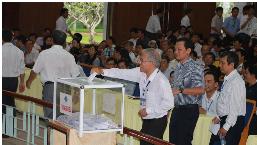
Đại biểu bỏ phiếu tín nhiệm bầu ra đại diện giảng viên và nghiên cứu viên của các đơn vị tham gia Hội đồng Trường.

Nhằm hoàn thiện cơ cấu nhân sự cho Hội đồng Trường, Hội nghị cán bộ chủ chốt đã tiến hành bỏ phiếu tín nhiệm bầu ra các thành viên đại diện giảng viên và nghiên cứu viên của các đơn vị trong Trường tham gia Hội đồng Trường ĐHCT nhiệm kỳ 2017-2022.