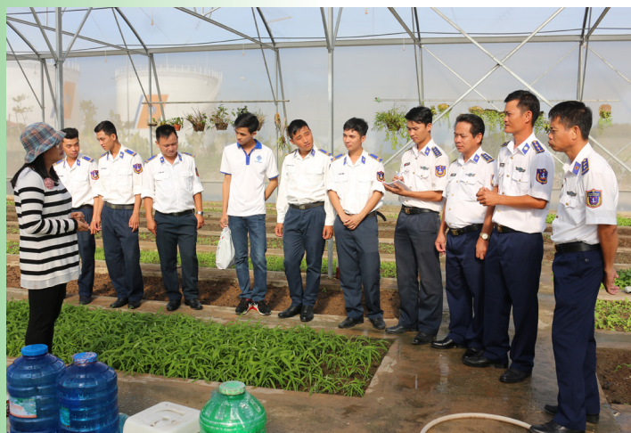
Tập huấn kiến thức trồng trọt cho chiến sĩ Vùng Cảnh sát biển 4.

Tình yêu biển, đảo được nhân lên trong đêm giao lưu văn nghệ với chủ đề “Hát về biển, đảo quê hương” ngay trên Đảo Ngọc-Phú Quốc, huyện đảo giàu truyền thống cách mạng, đang phát triển mạnh mẽ, tươi đẹp và mến khách. Thông qua những lời ca, tiếng hát, điệu múa, những tiết mục văn nghệ đặc sắc, trẻ trung, sôi động trong chương trình giao lưu, tuổi trẻ của hai đơn vị càng hiểu sâu sắc hơn về tầm quan trọng của biển, đảo Việt Nam; qua đó củng cố lòng yêu nước, yêu biển, đảo quê hương; đồng thời tăng cường mối quan hệ đoàn kết quân-dân; từ đó nâng cao trách nhiệm trong bảo vệ vững chắc chủ quyền và thực thi pháp luật trên vùng biển Tây Nam của Tổ quốc.