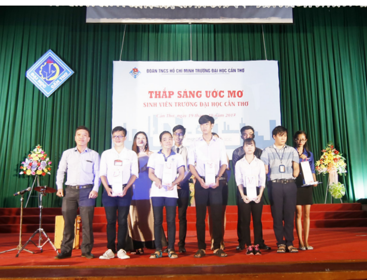
Trao học bổng và quà tặng cho 05 bạn sinh viên.

Thắp sáng ước mơ sinh viên Trường ĐHCT là một chương trình hết sức ý nghĩa để tôn vinh những ước mơ đẹp, những tấm gương tiêu biểu giàu nghị lực, biết vượt qua nghịch cảnh để vươn lên trong cuộc sống; tiếp thêm niềm tin, động lực cho các bạn trẻ vững bước trên con đường lập thân, lập nghiệp. Mong rằng chương trình sẽ tiếp tục nhận được sự quan tâm, tài trợ của quý công ty, doanh nghiệp, tổ chức, cá nhân, sự đồng hành của các cơ quan truyền thông để hoạt động được thực hiện định kỳ và nhiều mảnh đời khó khăn, những tấm gương học sinh, sinh viên được giúp đỡ, vượt qua số phận, vươn lên trong học tập và cuộc sống.