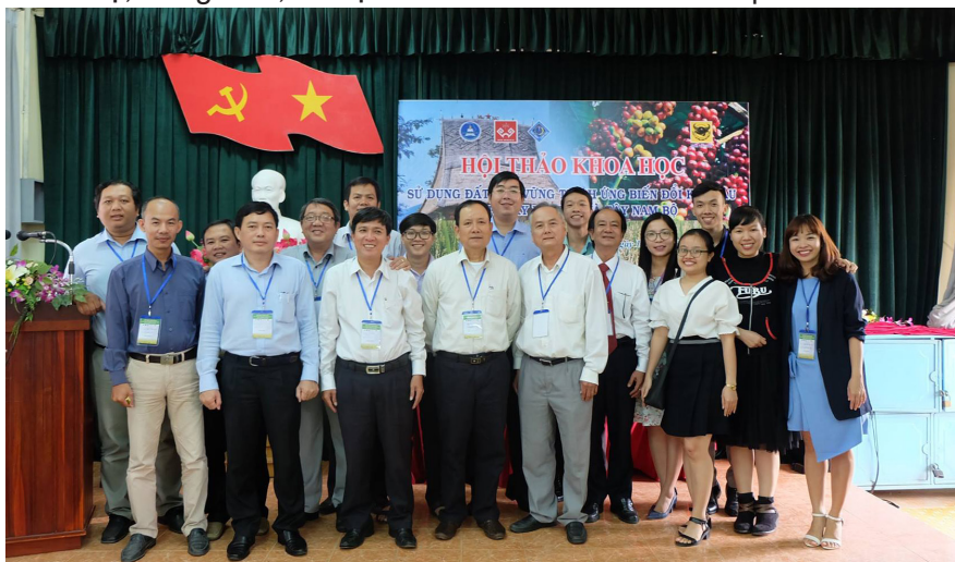
Đoàn Trường ĐHCT chụp hình lưu niệm tại Hội thảo.

Kết luận của Chủ trì Hội thảo đã khẳng định đây là cơ hội vàng để các nhà quản lý, nhà khoa học gặp gỡ, giao lưu, chia sẻ những khó khăn và kinh nghiệm trong việc sử dụng đất và ứng dụng những thành tựu mới trong khoa học phù hợp với biến đổi của khí hậu cho các tỉnh Tây Nguyên và khu vực Tây Nam Bộ. Ông Vương Hữu Nhi đã chân thành tiếp nhận các nghiên cứu tại Hội thảo và mong muốn phối hợp triển khai dựa trên Chương trình Nông thôn miền núi hoặc đề tài do Sở KH&CN chủ quản năm 2018.