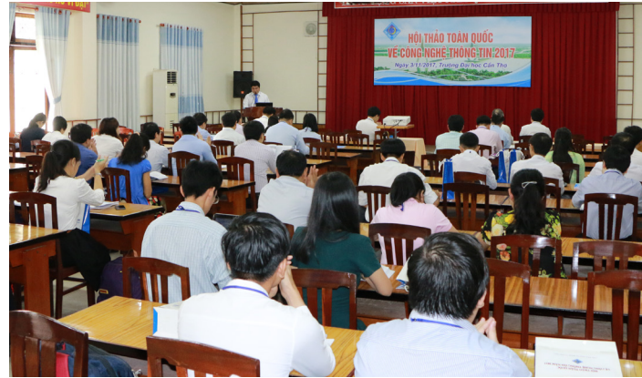
Hội thảo toàn quốc về CNTT năm 2017 diễn ra tại Hội trường Khoa CNTT&TT-Trường ĐHCT ngày 03/11/2017.

Hội thảo đã nhận được 43 bài viết do các nhà khoa học, giảng viên, nghiên cứu sinh, học viên từ các viện, trường của khu vực ĐBSCL, thành phố Hồ Chí Minh và Đà Nẵng với nội dung bao hàm các lĩnh vực như: công nghệ tri thức, công nghệ đa phương tiện, tính toán hiệu năng cao, khai phá dữ liệu và máy học, mô hình hóa, mô phỏng, xử lý ngôn ngữ, nhận dạng và xử lý ảnh, an ninh mạng, điện toán đám mây, công nghệ phần mềm, IoT, các hệ thống thông minh và hệ thống hỗ trợ quyết định. Có 33 bài viết được chọn đăng trong Kỷ yếu của Hội thảo, đặc biệt 23 bài viết tốt nhất được chọn đăng trong Tạp chí Khoa học Trường ĐHCT.