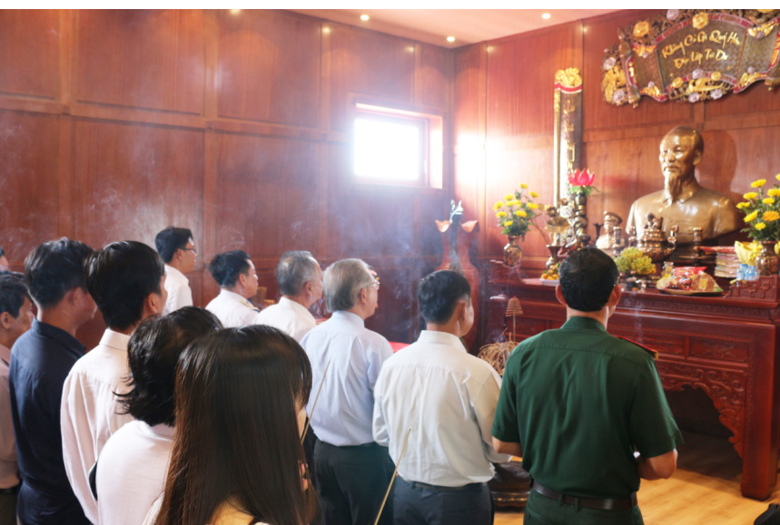
Thắp hương tưởng nhớ Bác Hồ tại Bộ Tư lệnh Vùng Cảnh sát biển 4.

Từ ngày 25 đến ngày 27/11/2017, Ban Chấp Công Đoàn Trường ĐHCT phối hợp với Đoàn Thanh niên và Phòng Công tác Chính trị tổ hoạt động thăm hỏi và giao lưu với cán bộ, chiến sĩ Bộ Tư lệnh Vùng Cảnh sát biển 4 và Bộ Tư lệnh Vùng 5 Hải quân tại Phú Quốc, Kiên Giang.