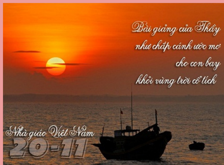
Ảnh minh họa.

Chúng em là sinh viên và được học tập trên giảng đường đại học hôm nay tất cả là nhờ sự dìu dắt tận tình của thầy, cô. Đó là những đêm thầy, cô thức trắng miệt mài bên từng trang giáo án, là những lần đội mưa tới trường vì sợ chúng em trông, sợ chúng em đợi chờ và lo lắng.