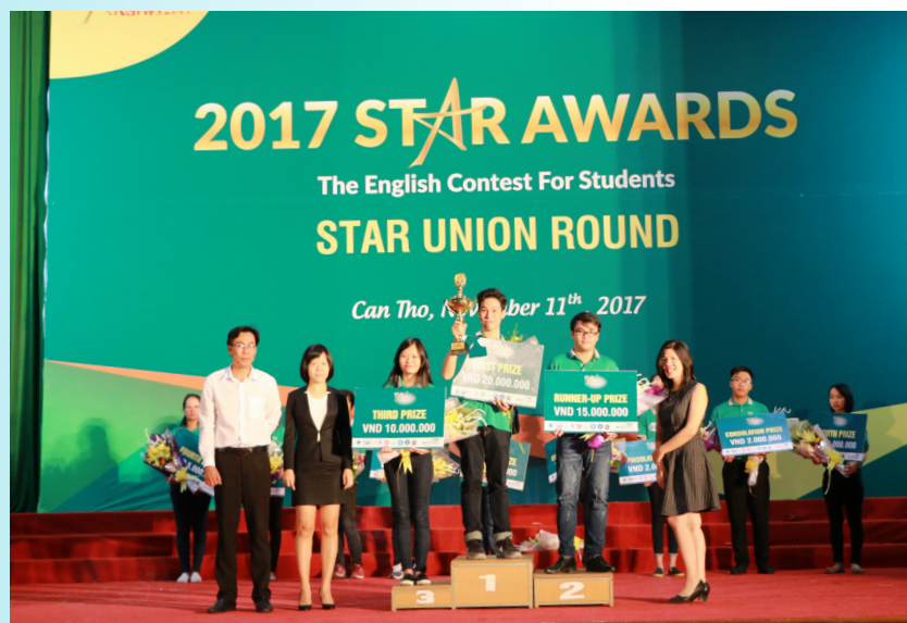
Cuộc thi tiếng Anh trong sinh viên - Giải thưởng STAR AWARDS 2017 kết thúc thành công tốt đẹp.

Cuộc thi STAR AWARDS 2017 đã khép lại nhưng dư âm vẫn còn và đó sẽ là nguồn động lực cho các bạn sinh viên khác với mong muốn khám phá và chinh phục những đỉnh cao tri thức trong thế giới hội nhập nơi mà ngoại ngữ là phương tiện quan trọng để tiếp cận. Mong rằng các bạn sinh viên hãy nỗ lực từng ngày trong học tập ngoại ngữ và rèn luyện các kỹ năng cần thiết, làm hành trang vững chắc vào con đường nghề nghiệp tương lai.