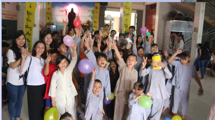
Toàn cảnh buổi giao lưu với các em nhỏ.

đang được nuôi dưỡng tại chùa Bửu Trì; góp phần xoa dịu những khó khăn, vất vả và những mất mát, thiệt thòi của các em; bên cạnh đó, thể hiện sự quan tâm, lo lắng của xã hội, tạo động lực để các em cố gắng học tập vươn lên trong cuộc sống.